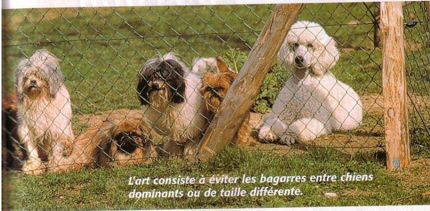
L'art consiste à éviter les bagarres entre chiens dominants ou de taille différente.

Avant d'amener son animal en pension, on devra fournir les papiers suivants : le certificat de vaccination ; la carte d'identification. Enfin si le nom et l'adresse du maître sont nécessairement communiqués, il est important de donner son numéro de téléphone, voire de téléphone portable en cas d'urgence ainsi que les coordonnées du vétérinaire.